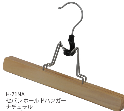
H-71NA セバレ ホールドハンガー ナチュラル サイズ(約)25×17×2.5cm JAN 4962959 189716 入数 60