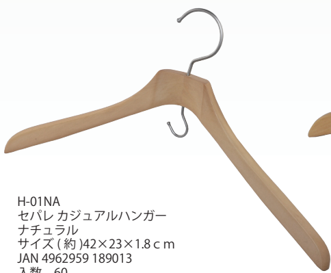
H-01NA セバレ カジュアルハンガー ナチュラル サイズ(約)42×23×1.8cm JAN 4962959 189013 入数 60

自然のぬくもりが伝わる、やさしい手ざわりの天然木を贅沢に使用しました。ハンガーを支える金具にはこだわりのつや消しシルバー色のブロンズコーティングを採用して天然素材のやさしい風合いを生かしています。毎日手がふれる物だからこそ、やさしい風合いを大切にしています。