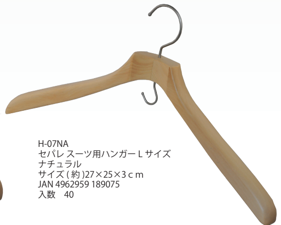
H-07NA セバレ スーツ用ハンガーLサイズ ナチュラル サイズ(約)27×25×3cm JAN 4962959 189075 入数 40