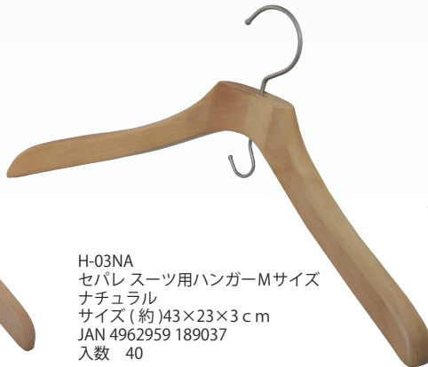
H-03NA セバレ スーツ用ハンガーMサイズ ナチュラル サイズ(約)43×23×3cm JAN 4962959 189037 入数 40